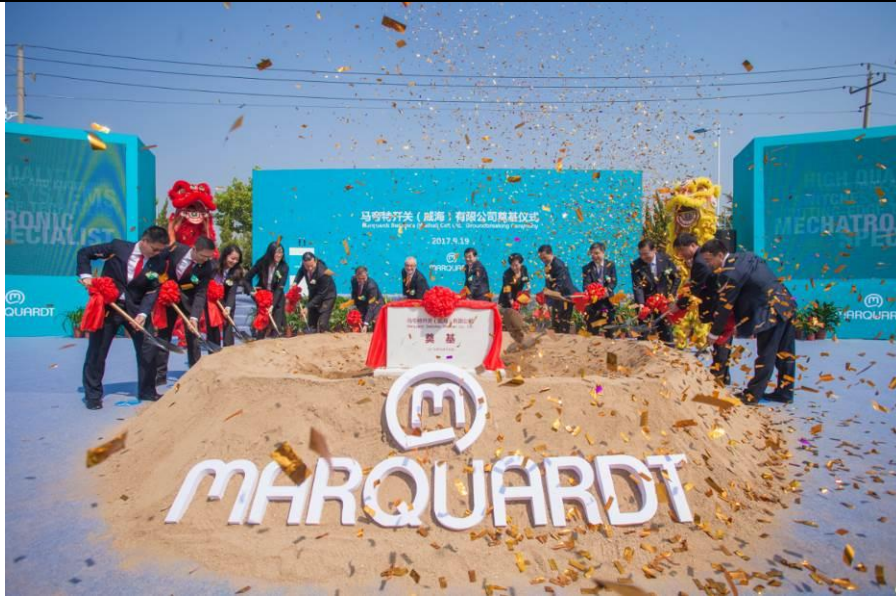
Marquardt_Press_Geschäftsjahr_2017_Weihai_3.jpg: Strategische Weichenstellung in Asien: Marquardt baut in Weihai sein zweites Produktionswerk in China.