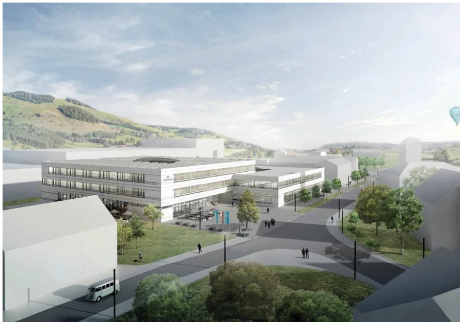
Marquardt_Press_Geschäftsjahr_2017_EIZ_4.jpg: Am Firmensitz in Rietheim-Weilheim baut Marquardt ein Entwicklungs- und Innovationszentrum für über 30 Mio. Euro.